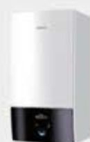
Unité intérieure murale

Le + Possibilité de rajouter un ballon ECS déporté