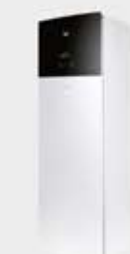
Unité intérieure au sol