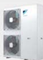
Groupe extérieur R-32