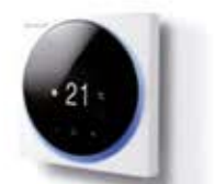
Thermostat Madoka chauffage BRC1HHDW/S/K