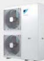
Groupe extérieur R-32